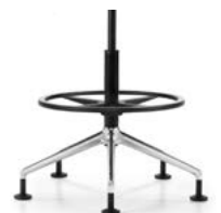
_9 Fünfsternfuss, Fussring, Alu schwarz | poliert, Rollen | Gleiter Piétement à 5 branches avec repose-pieds, alu noir | poli, roulettes | glisseurs