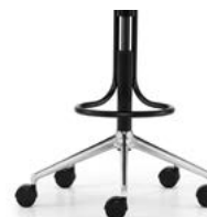
_4 Fünfsternfuss, Fussbügel, Alu schwarz | poliert, Rollen | Gleiter Piétement à 5 branches avec repose-pieds en arceau, alu noir | poli, roulettes | glisseurs