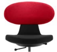
_2 bicolor bicolore