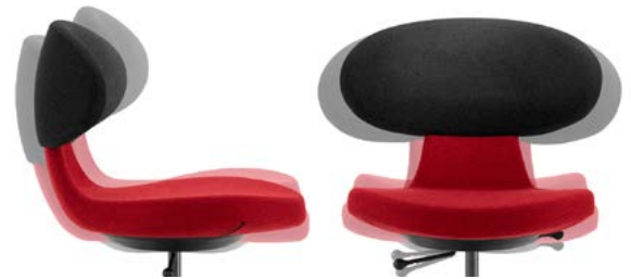
_1 3D Bewegungsmechanik Mécanisme de mobilité 3D