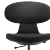
_1 einfarbig unicolore